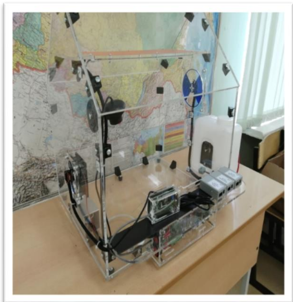
«Мастерская агропромышленного профиля»