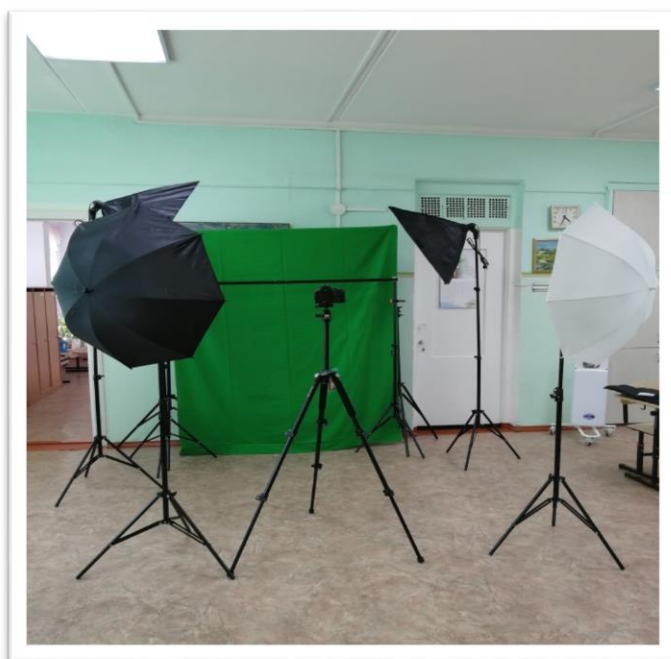
Студия декоративно-прикладного искусства, фото и видео студия